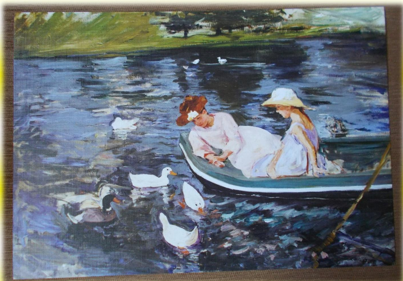
Mary Cassatt, Lato