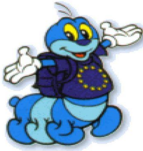
Maskotka UE - Syriusz