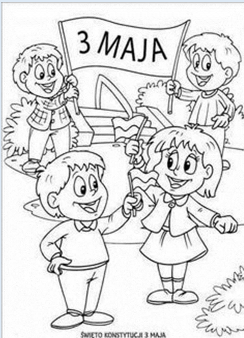
ŚWIĘTO KONSTYTUCJI 3 MAJA