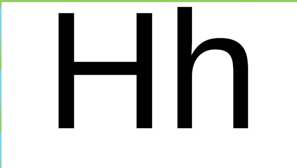
Rysunek 1 Literka drukowana