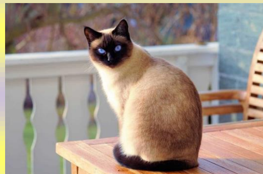
Rysunek 4 Który kot ma dłuższą sierść?