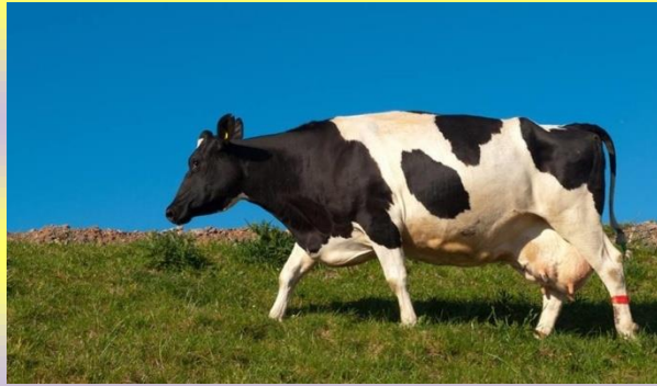
Rysunek 2 Które zwierzę ma dłuższy ogon?