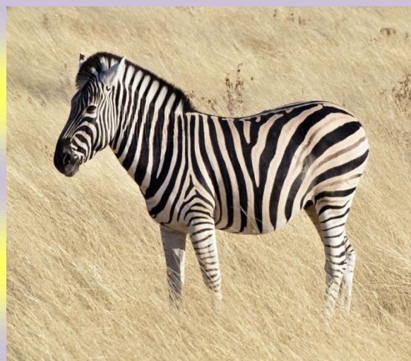
Rysunek 1 Które zwierzę ma dłuższą szyję?